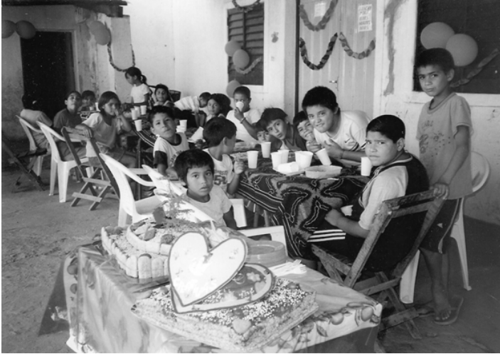
Manitos Creativos im Sommer 2010.

zusätzliche Materialien sorgen, da die vorhandenen langsam ausgingen... Die Kinder bastelten fleißig an kleinen Krippen aus Stoffresten, Tannenbäumen aus Pappe und anderem Weihnachtsschmuck.